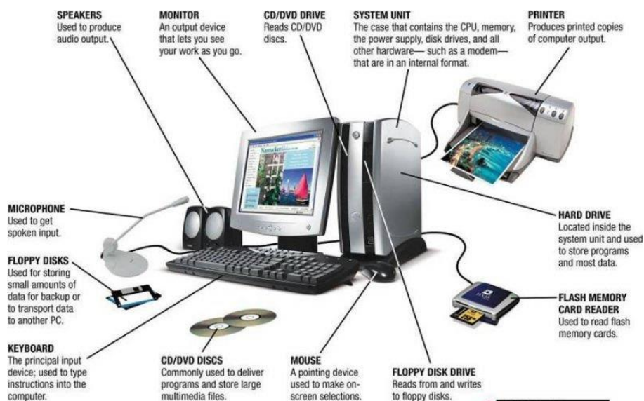
FIGURE 1-7 Typical computer hardware.